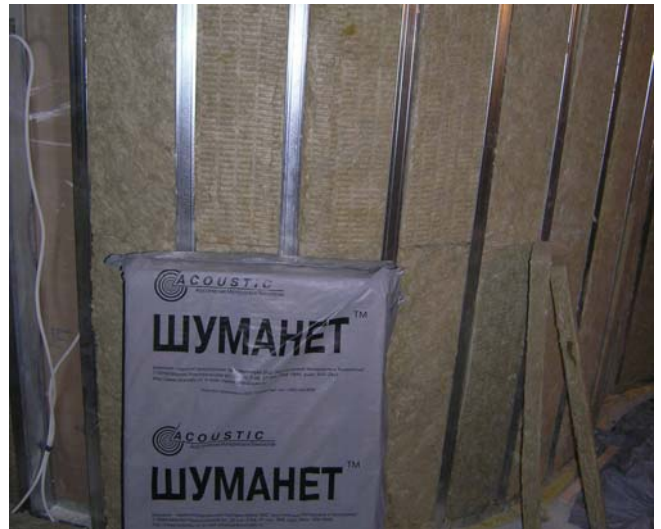
Плита звукопоглощающая Шуманет БМ Профиль стоечный Лист ГКЛ/ГВЛ